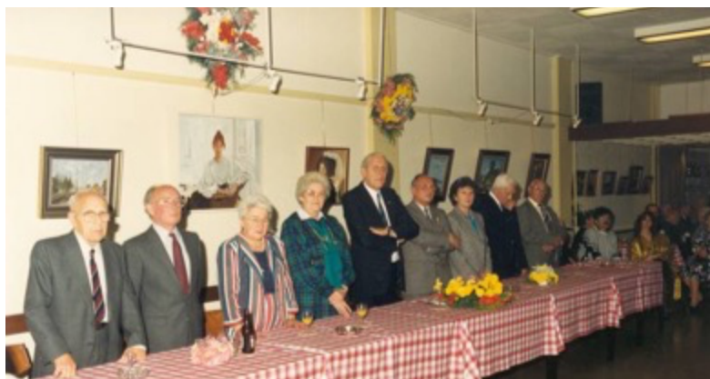
Foto: 25-jarig jubileum KBO Drunen