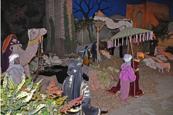
december 2009. Kerststal in de St. Lambertuskerk.