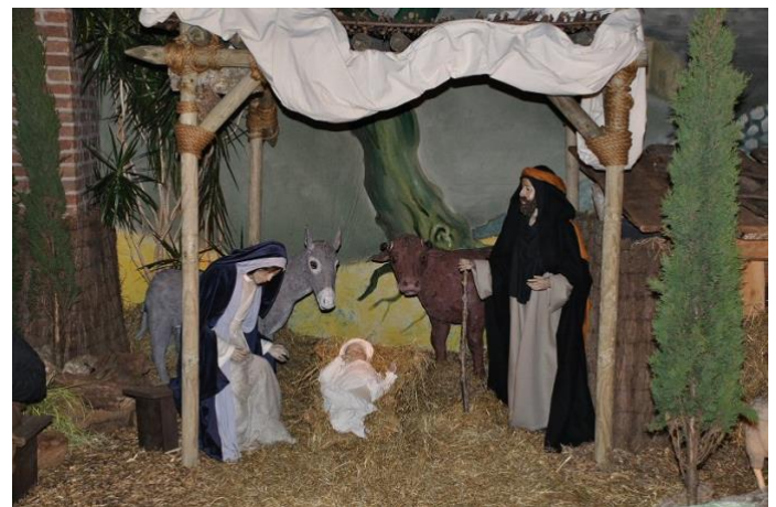
december 2009. Kerststal in de St. Lambertuskerk.